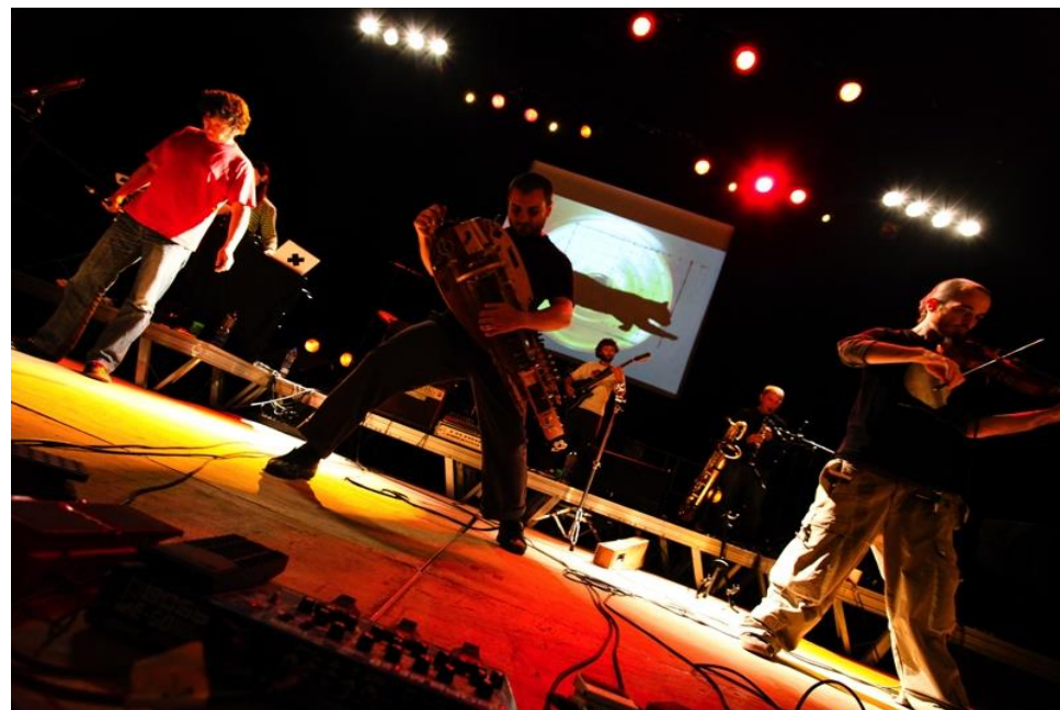
Salle Didier Lockwood