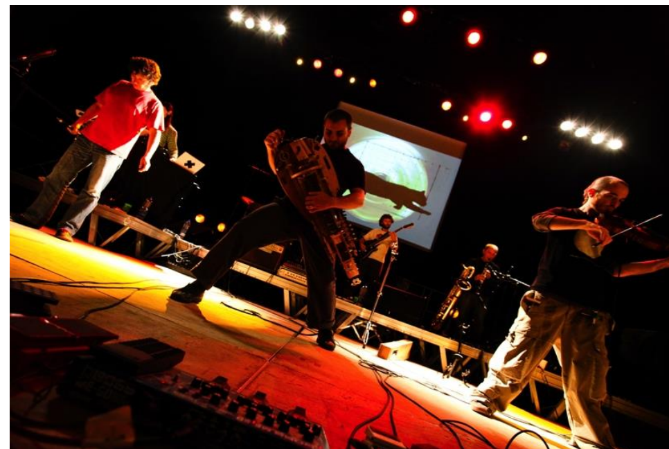
Salle Didier Lockwood